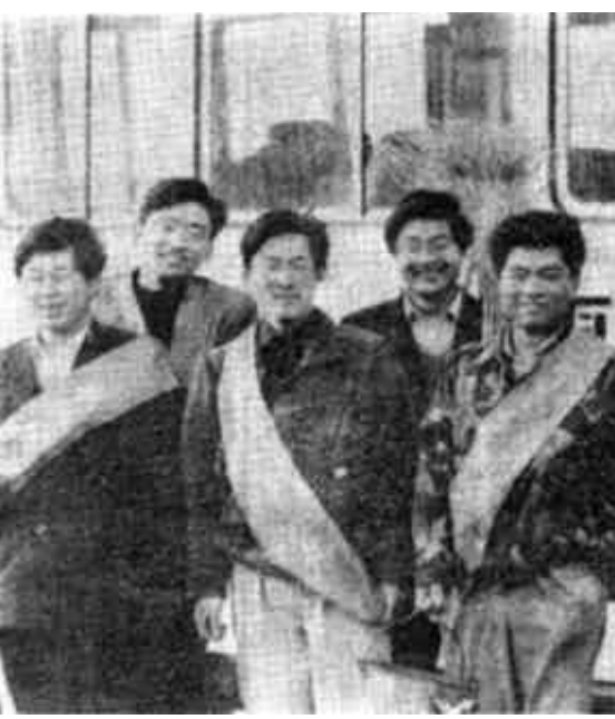
市运输三公司团总支队员们坚持岗位学雷锋，大力倡导敬业精神、义务奉献精神及厉行节约的良好风气，多次受到共青团省、市委的表彰，最近又被团市委评为学雷锋先进集体。

付窝乡党委、乡政府把基层调解工作作为社会治安第一道防线，紧把关口，常抓不懈，调解成功率达到95.7%，促进了社会治安的稳定。